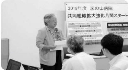
職員と共に地域に出ようと訴える北岡副会長