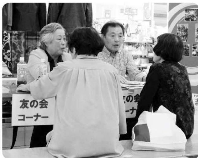
友の会コーナーで入会を勧める堤会長と北岡副会長