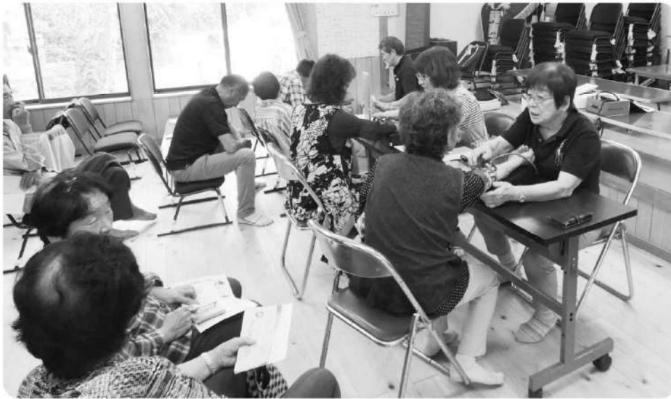
旺盛に取り組んだ、荒尾・牛水地区での健康チェック

不知火健康友の会では地域の要求に応え、旺盛に健康チェック活動に取り組んでいます。地域の老人会やサロンからの要望に対し、血圧測定その他、体脂肪、血管年齢、骨密度測定等を行なっており、大変好評です。9月29日と10月6日には荒尾の牛水地区で老人会の健康チェックを行い、2日間で70名ほどの方が見え、海に近く、しっかりと栄養をとってあるためか、骨密度の測定数値もよい結果の方が多数でした。