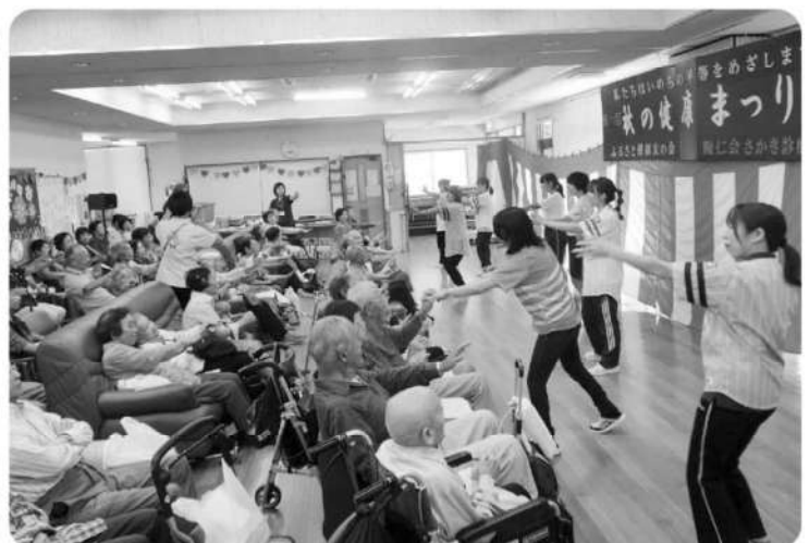
職員の元気な踊りを披露