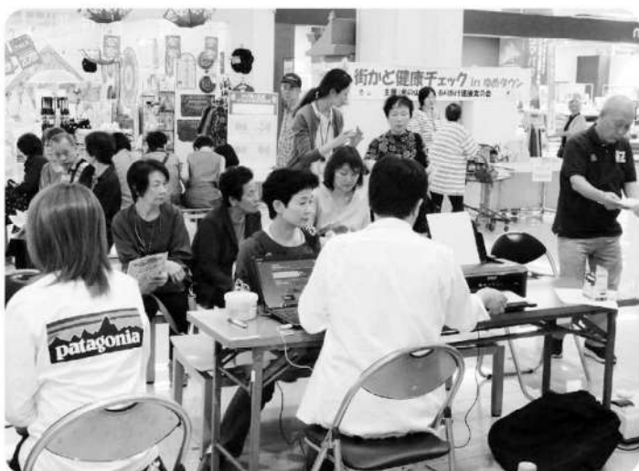
血管年齢測定にはいつも長蛇の列が