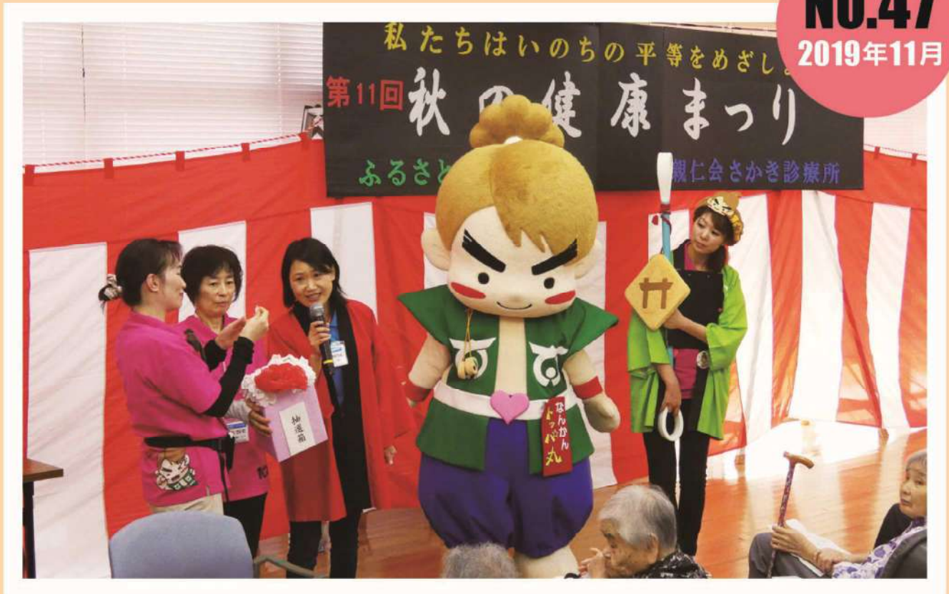
ふるさと健康友の会・さかき診療所の健康祭りでの抽選会風景